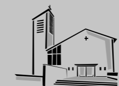
Zum Guten Hirten / Buon Pastore Stammheim