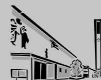
Hl. Dreifaltigkeit Rot / Zazenhausen