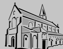
St. Antonius Zuffenhausen