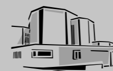
St. Laurentius / Nossa Senhora de Fatima Freiberg